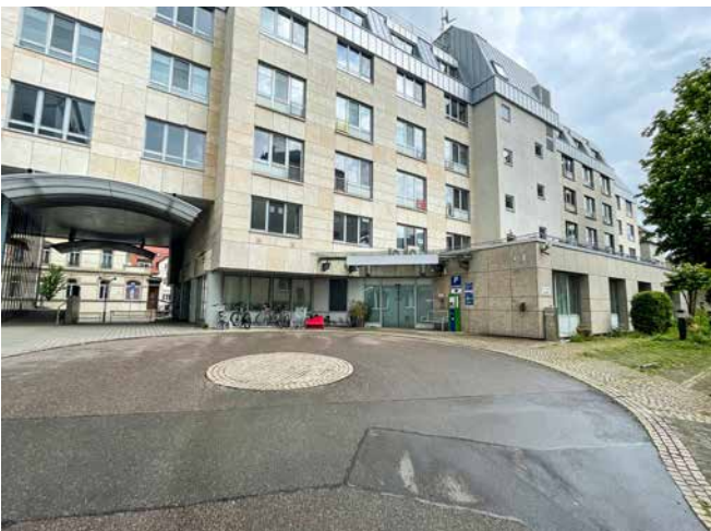
→ Das leere Klinikgebäude in der Badstraße