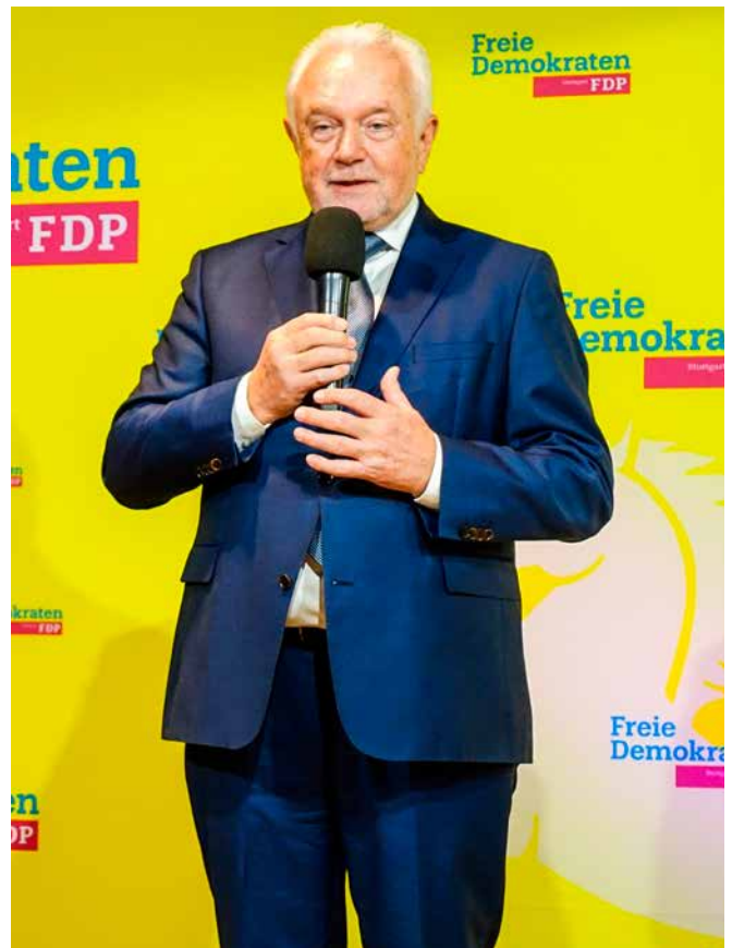
→ Wolfgang Kubicki beim Neujahrsempfang

Qualifizierungsoffensive, mehr Fachkräfteeinwanderung in den Arbeitsmarkt sowie eine Ausrichtung auf Zukunftstechnologien wie KI. Sein Fazit: Die Zeit sei reif für eine „Wirtschaftswende“ und eine Rückbesinnung auf marktwirtschaftliche Prinzipien.