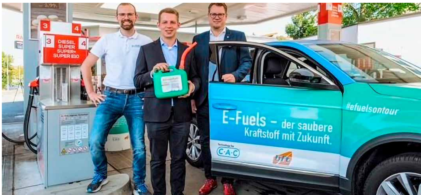
→ Mein Einsatz für synthetische Kraftstoffe geht weiter