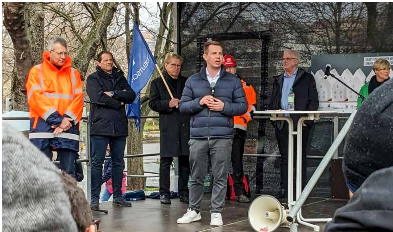
→ Solidarität mit unserer mittelständischen Bauwirtschaft

Fünf Jahre Opposition haben gezeigt: Baden-Württemberg leidet nicht an Erkenntnismangel, sondern an politischem Mut. Ob in der Verkehrspolitik oder im Wohnungsbau – Grün-Schwarz verwaltet Krisen, statt sie zu lösen. Es werden falsche Prioritäten gesetzt, Steuergelder vielfach verplempert. Unser Gegenentwurf ist klar und bleibt es mit Blick auf die Wahl am 8. März: weniger Ideologie, mehr Vernunft. Weniger Bürokratie, mehr Vertrauen. Technologieoffenheit, bezahlbares Bauen und eine Mobilitätspolitik, die den Menschen dient. Dafür braucht es eine starke FDP im Landtag – und den Wechsel von der Oppositionsbank in Regierungsverantwortung.