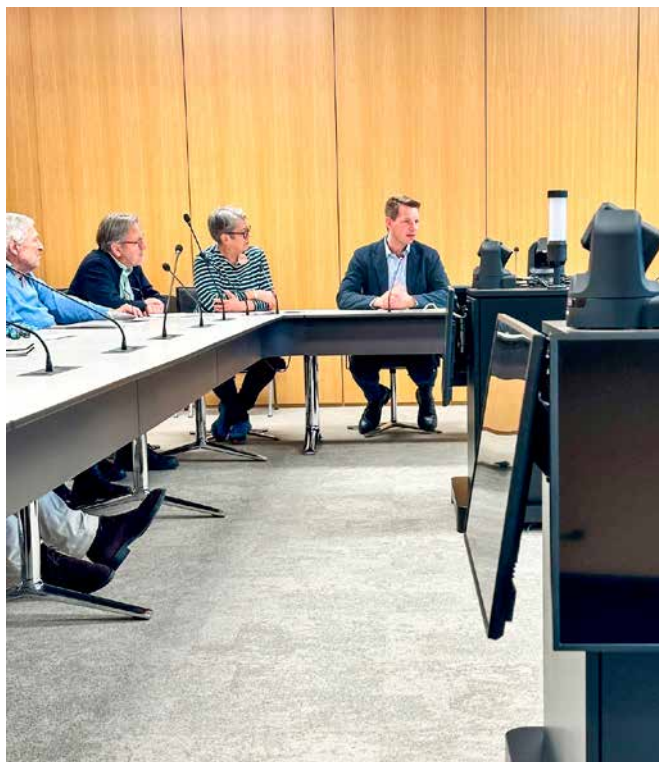
→ Diskussion mit der Besuchergruppe