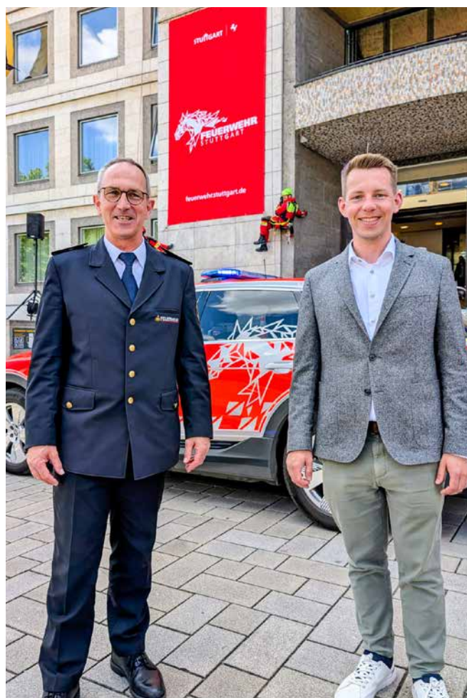
→ Stuttgarter Feuerwehr im neuen Design

Im Wohnungsbau fällt die Bilanz der Landesregierung besonders ernüchternd aus. Mit großem Tamtam wurde zu Beginn der Legislatur ein eigenes Ministerium für Landesentwicklung und Wohnen geschaffen. Vier Jahre später ist klar: Die Wohnungsbaukrise hat sich verschärft, Genehmigungszahlen brechen ein, Investoren ziehen sich zurück. Das Ergebnis aus dem Hause Razavi ist nur eines: Ankündigungs-