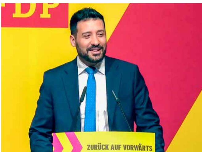
→ Alejandro Cacace, Staatssekretär für Deregulierung in Argentinien

Ein Antrag wollte die Verbeamtung auf einige wenige Berufsgruppen mit hoheitlichen Aufgaben beschränken. Hier gab es gute Argumente dafür und gute dagegen. Nach einer leidenschaftlich geführten Diskussion wurde dieser Antrag