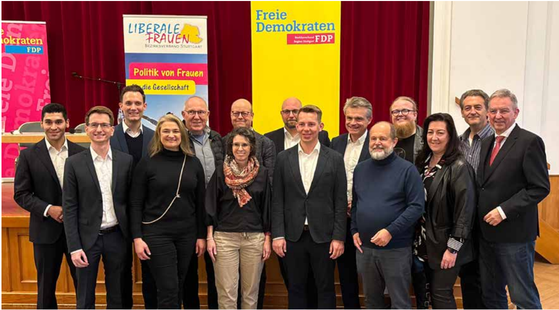
→ Der neue Vorstand der FDP Region Stuttgart