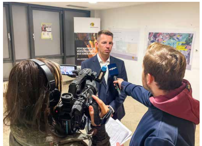
→ Klare Worte für die Presse: keine Forensik in Bad Cannstatt