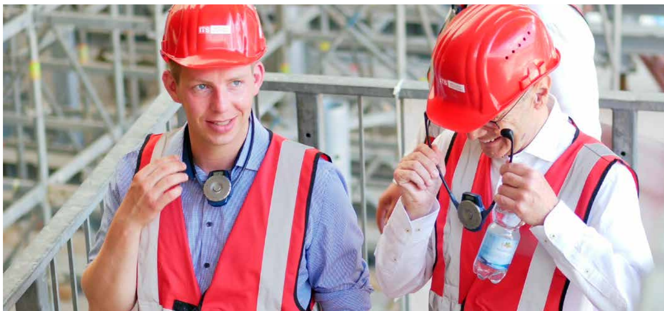
→ Besichtigung der S21-Baustelle