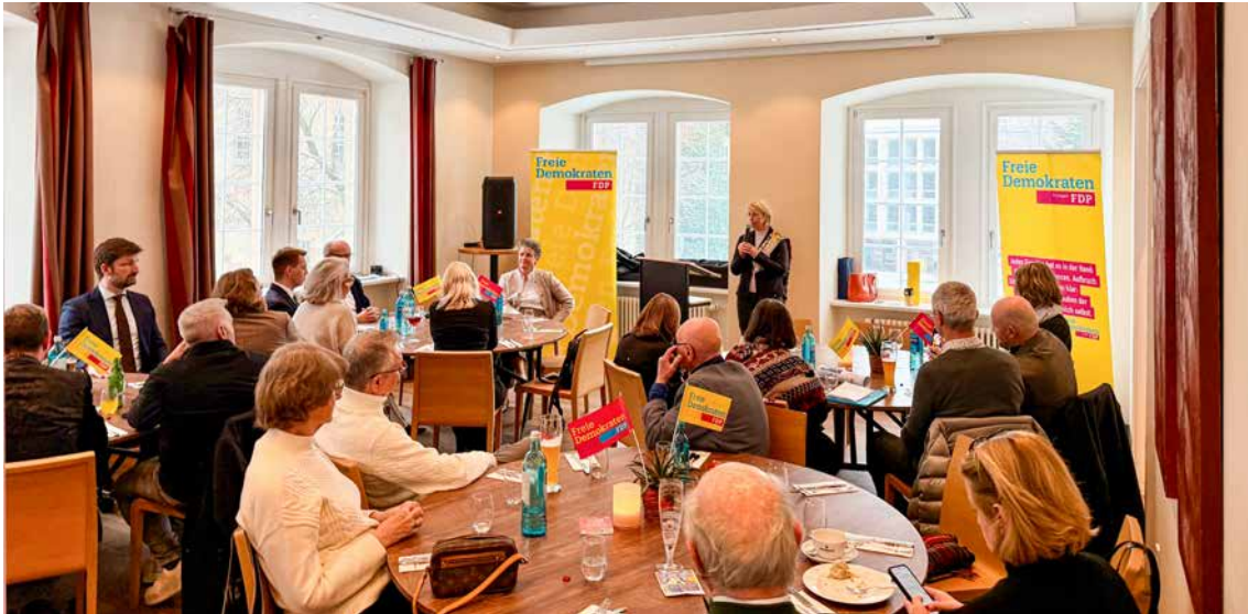
→ Gäste beim Neujahrstreff in der Alten Kanzlei

Zusammenarbeit möglich sei. Gerade beim Bürokratieabbau habe die FDP viel angestoßen und erreicht. Ein konkretes Beispiel sei die Bauordnung: In Sachsen-Anhalt wurden die Bauvorschriften für Ein- und Zweifamilienhäuser entschlackt und dem Bauherrn mehr Verantwortung dafür übergeben, dass sein Haus ordnungsgemäß geplant, gebaut oder renoviert wird.