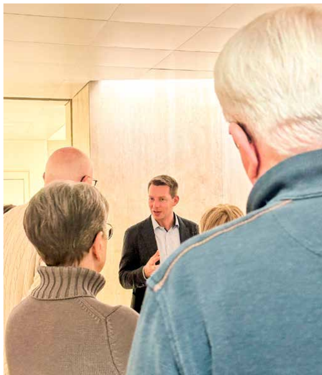
→ Aus dem ganzen Wahlkreis kamen Interessierte