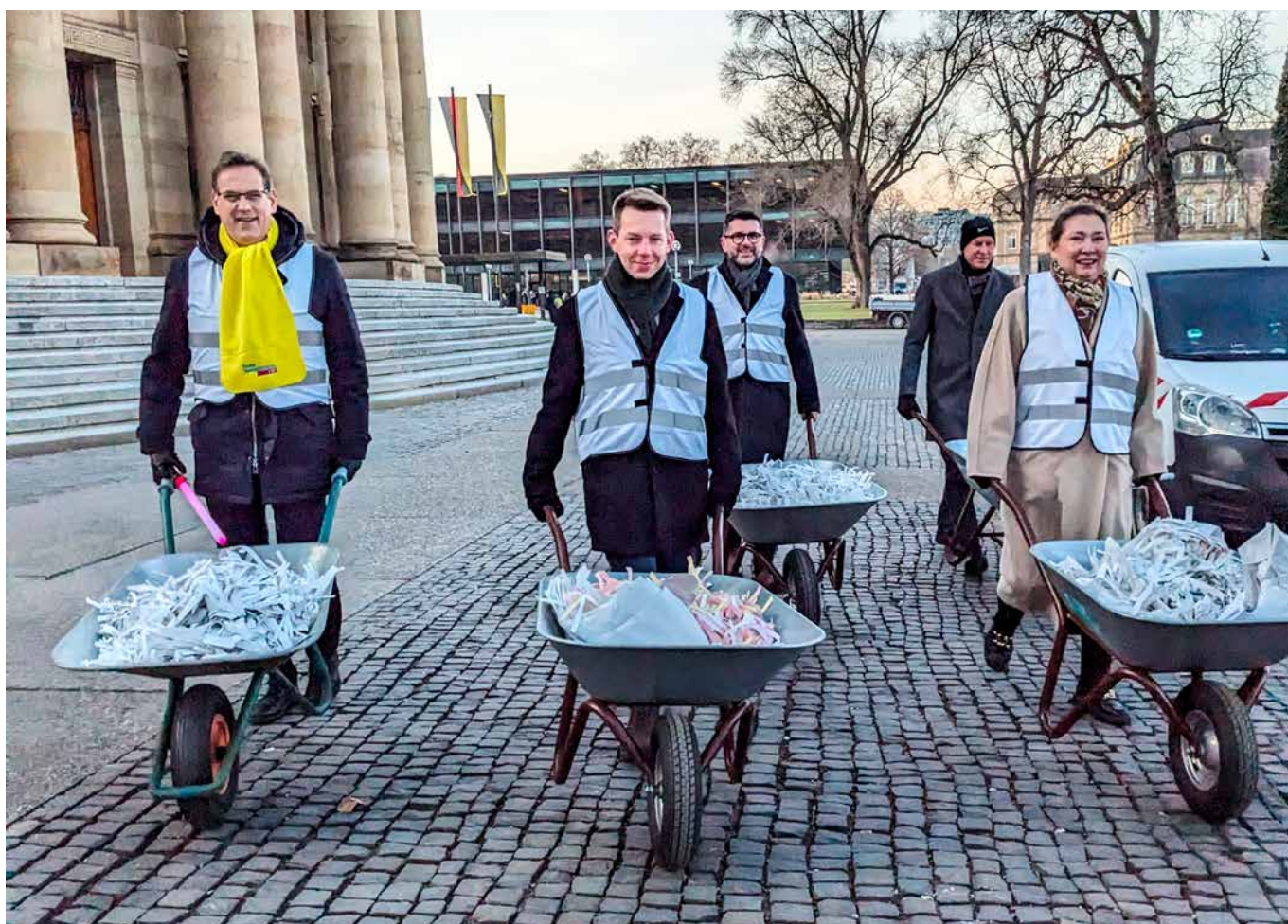
→ Bei einer Fraktionsaktion zum Bürokratieabbau