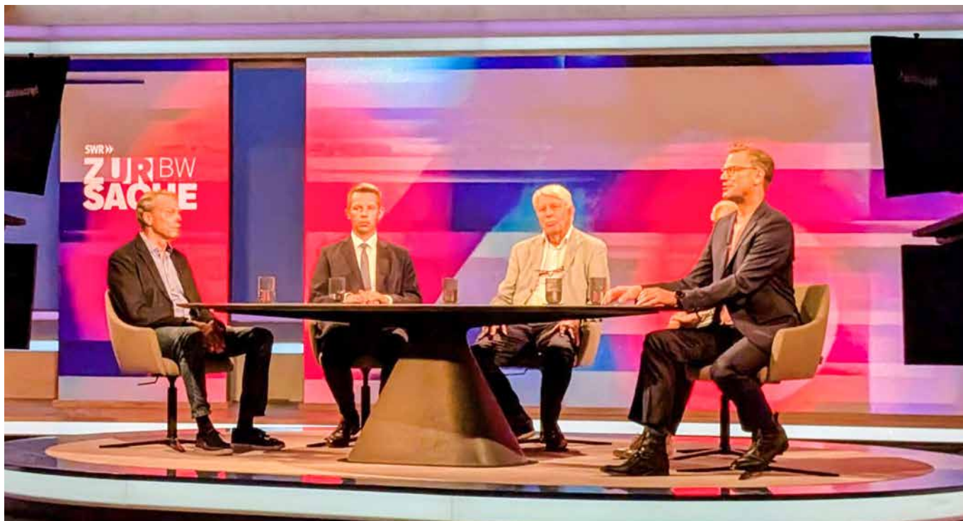
→ Im TV-Studio. Thema: Senioren am Steuer