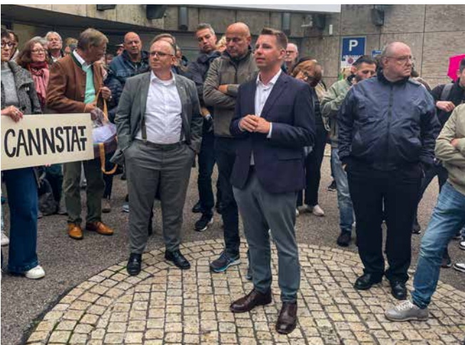
→ Bei einer Anwohnerdemo an der Klinik

Am Beispiel von MAHLE zeigt sich, wie groß die Gefahr ist, wenn das Verbrenner-Aus der EU kommen sollte: In Baden-Württemberg könnten zwei Drittel der Arbeitsplätze verloren gehen und die technologische Entwicklung in diesem Bereich abbremsen. MAHLE ist weltweit einer der führenden Automobilzulieferer. Angesichts der prekären Situa-