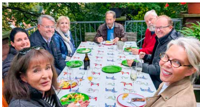
→ Die einen grillen, die anderen genießen schon