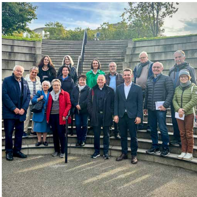
→ Meine Gästegruppe beim Landtagsbesuch

statt sie zu verhindern. Viele Studierende aus dem Umland sind auf ihren Pkw angewiesen. Mit den voraussichtlich steigenden Zahlen in den nächsten Semestern wird sich das Problem noch verschärfen.