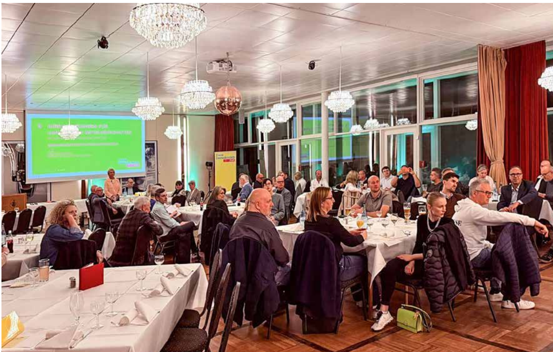
→ Die Mitglieder bei der Kreismitgliederversammlung hören den Musikbeiträgen zu.