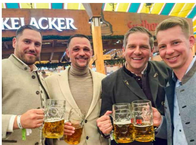
→ Bei der Eröffnungsfeier im Festzelt