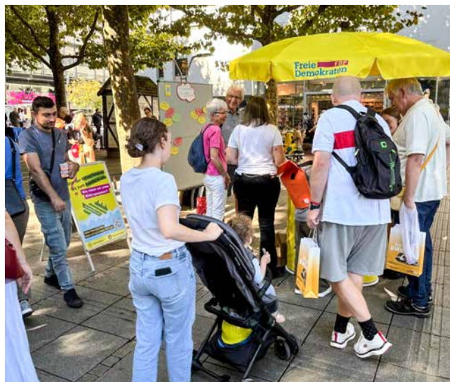
→ Der Stand war gut besucht.