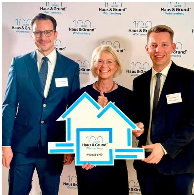
→ Zu Gast bei der Jubiläumsfeier von Haus & Grund

Herzlichen Glückwunsch zum Jubiläum! Haus & Grund Württemberg feiert dieses Jahr sein 100-jähriges Bestehen und ist mehr denn je eine wichtige Interessenvertretung für private Vermieter und Investoren. Bei der Jubiläumsfeier im Alten Schloss Stuttgart wurde sehr deutlich, welche Bedeutung privates Eigentum für unsere Gesellschaft hat. Gerade für junge Menschen in Baden-Württemberg ist der Erwerb von Wohneigentum wichtig – er bedeutet Sicherheit, Unabhängigkeit und eine starke Basis für die Zukunft.