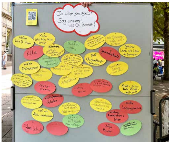
→ Sammlung der Rückmeldungen