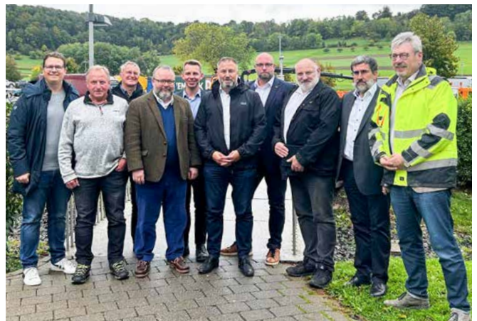
→ Vor-Ort-Termin mit Bürgermeistern an der Raststätte Gruibingen