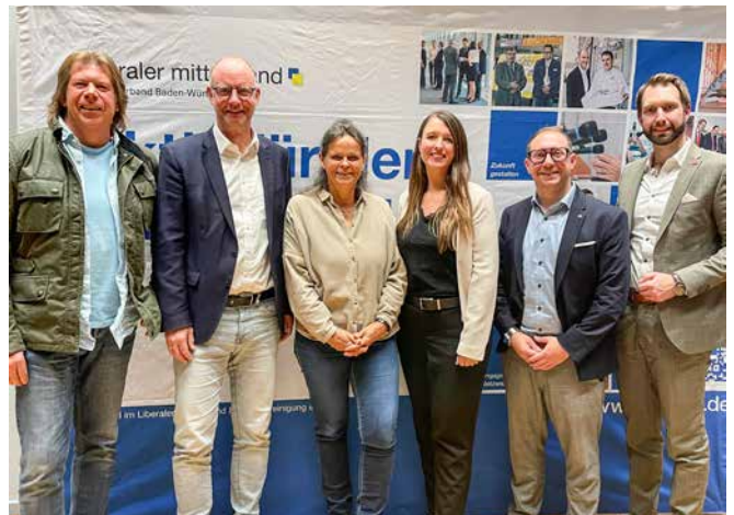
→ Referenten, Moderator und LIM-Landesvorsitzender (links)

Auch im LIM Stuttgart sind Handwerker organisiert. Umso aufmerksamer verfolgten diese den Antrag der FDP-Fraktion im Landtag zum Bürokratieabbau für das Handwerk. „Alle Forderungen sind praxisnah und nur zu begrüßen“, sagt