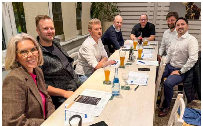
→ Die Stadtgruppe trifft sich wieder regelmäßig