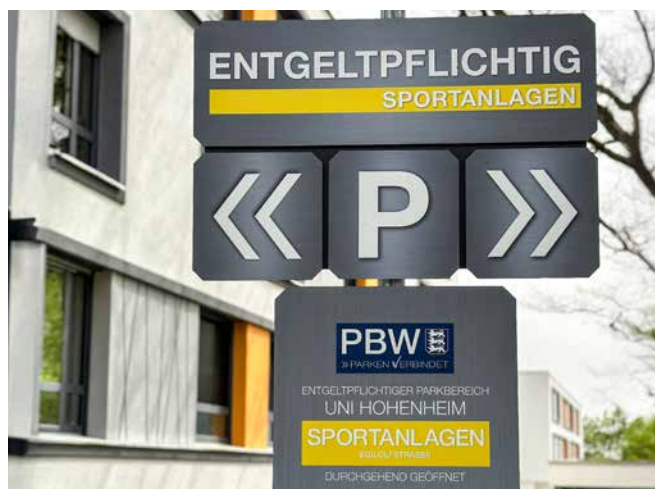
→ Parkplätze an der Uni Hohenheim kosten seit 2020 Gebühr

Grüne Verkehrspolitik kassiert ab, statt bezahlbare Mobilität zu ermöglichen – durch Antworten aus dem Verkehrsministerium fühle ich mich wieder einmal bestätigt, wenn es um die Parkraumbewirtschaftung an der Uni Hohenheim geht. Nachdem bekannt wurde, dass die lang ersehnte direkte U25-Linie vom Hauptbahnhof zum Campus vorerst nicht kommen wird und die Busverbindungen so bleiben wie sie sind, hakte ich bei Winfried Hermann nach. Könnte er nicht das kostenpflichtige Parken an der Uni wenigstens so lange aussetzen, bis eine spürbar bessere ÖPNV-Anbindung eingerichtet ist? Das würde den Studierenden helfen, aber auch die Anlieger in Birkach und Plieningen entlasten, deren Straßen häufig zugeparkt sind. Obwohl das Ministerium die Busverbindungen als störanfällig einstuft und die Lage vor Ort kennt, hält es an der Parkraumbewirtschaftung fest. Das zeigt, wie wenig der Verkehrsminister die Realität der Studierenden und Beschäftigten der Universität im Blick hat. Durch die dezentrale Lage ist der Standort benachteiligt, was die Erreichbarkeit betrifft. Mit dem Festhalten an den Parkgebühren wird die derzeit zuverlässigste Anfahrtsmöglichkeit – mit dem Auto – unnötig eingeschränkt. Der Verkehrsminister sollte bezahlbare Mobilität ermöglichen,