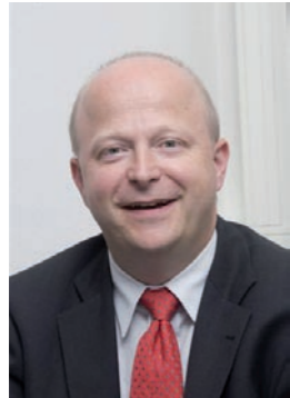
Michael Theurer Mitglied des Europäischen Parlaments Diplom-Volkswirt Oberbürgermeister a.D.